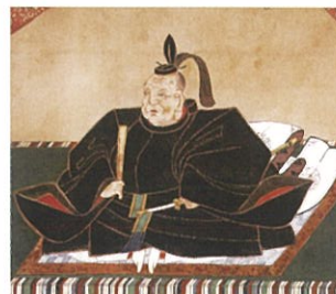
徳川家康画像(東照大権現像)(部分) 伝狩野探幽筆 4月12日～5月6日公開

※20名様以上の団体は一般200円、その他100円割引 ※毎週土曜日は小・中・高生入館無料