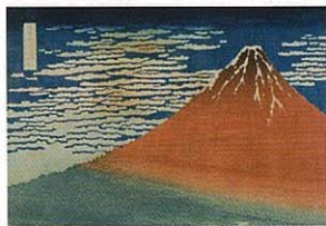
葛飾北斎画「富嶽三十六景 凱風快晴」平木浮世絵財団蔵