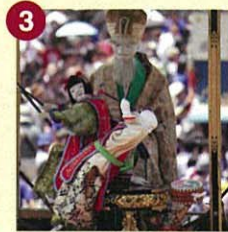
【鹿子神車】かしかじんしゃ (西之切奉賛会)