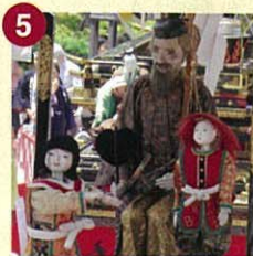
【王義之車】おうぎししゃ (古出来町奉賛会)