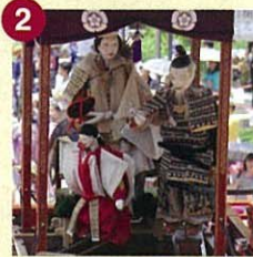
【神皇車】じんこうしゃ (筒井町神皇車保存会)