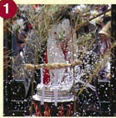
【湯取車】ゆとりぐるま (湯取車保存会)