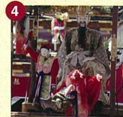
【河水車】かひいしゃ (中之切奉賛会)