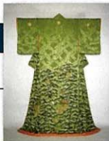
萌黄紋縮緬地雪持竹雀文牡丹紋付小袖 徳川記念財団蔵

●徳川美術館 TEL:052-935-6262 ●名古屋市蓬左文庫 TEL:052-935-2173