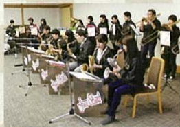
Vivid Jazz Band (中部楽器技術専門学校)