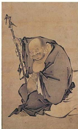
布袋図 徳川美術館蔵

本展では、徳川美術館に伝わる絵画作品や工芸品から、彼らの魅惑的な世界へと誘います。