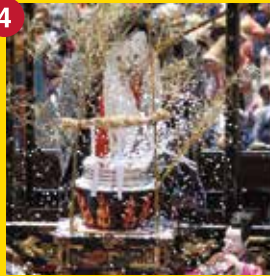
【湯取車】ゆとりぐるま (湯取車保存会)