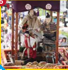
【神皇車】じんこうしゃ (筒井町神皇車保存会)