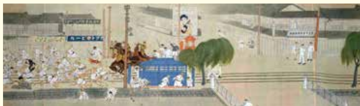
米騒動絵巻(部分) 桜井清香筆 徳川美術館蔵

米騒動絵巻には、大正7年当時の名古屋の様子がいぎいと描かれています。 この絵巻を通して、100年前の名古屋の街へと誘います。