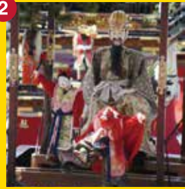
【河水車】かすいしゃ (中之切奉賛会)