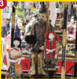
【王義之車】おうぎししゃ (古出来町奉賛会)