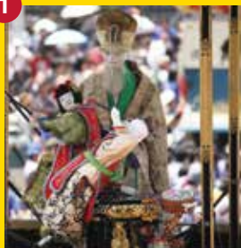
【鹿子神車】かしかじんしゃ (西之切奉賛会)