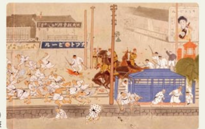
米騒動絵巻(部分) 桜井清香 筆