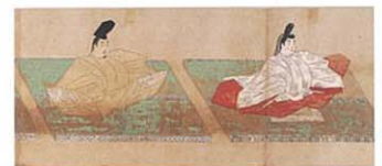
重要文化財 天皇摂関御影(部分)