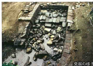
発掘の様子

戸山屋敷は現在の東京都新宿区の戸山町辺りで、今では面影を残す場所も数少なくなりましたが、平成10年(1998年)に早稲田大学の敷地内で江戸時代の大規模な石組みが見つかりました。早稲田大学と新宿区教育委員会による発掘調査の結果、戸山屋敷にあった龍門の瀧の遺構であることが確認されました。発掘された石材は、伊豆石と呼ばれる安山岩で、総数約360個、総重量約250tに上り、江戸城築城の余り石と推定されています。徳川園では、早稲田大学から譲り受けたこれらの石材を瀧の布落ちや護岸、河床、飛石などに用いるとともに、水量を急激に増す仕掛けを取り入れて、戸山屋敷の龍門の瀧を蘇らせました。