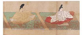
重要文化財 天皇摂関御影(部分)