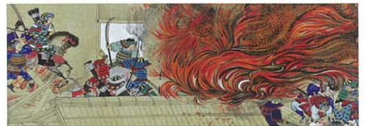
重要文化財 石山寺縁起絵巻 七巻の内、巻第六 部分 谷文晁筆 石山寺蔵 ※[展示期間]8/20～9/8

※20名様以上の団体は一般200円、その他100円割引 ※毎週土曜日は小・中・高生入館無料