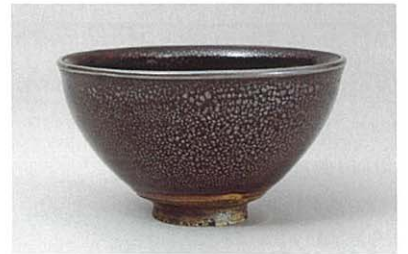
曜変天目(油滴天目) 大名物 徳川美術館蔵

※20名様以上の団体は一般200円、その他100円割引 ※毎週土曜日は小・中・高生入館無料