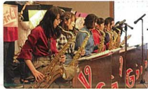
中部楽器技術専門学校