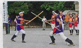
※内容は変更になる場合があります。

名古屋市指定無形民俗文化財、郷土芸能「棒の手」の演技をご覧いただけます。 【出演】源氏天流棒の手保存会