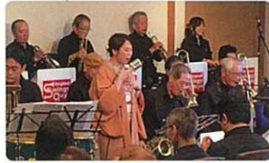
Original Swingy Guys