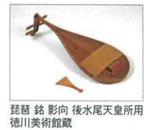
琵琶 銘 影向 後水尾天皇所用 徳川美術館蔵