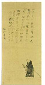
自画像賛「四月朱明節」 個人像

徳川美術館 TEL:(052)-935-6262 FAX:(052)-935-6261 名古屋市 蓬左文庫 TEL:(052)-935-2173 FAX:(052)-935-2174