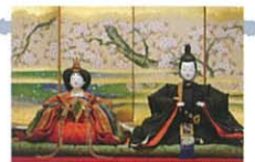
有職雛 徳川美術館蔵