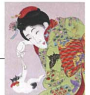
真美人 猫 楊州周延画 徳川美術館蔵