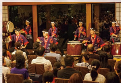
8月15日[土] 松蔭高校・和太鼓部