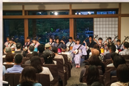
8月16日[日] 名古屋西高校・津軽三味線部

※それぞれの催事への参加・入場は無料ですが、別途入園料が必要です。 ※内容は変更になる場合があります。