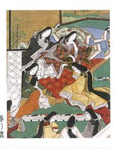
源氏物語絵巻 桐壺(部分) 個人蔵