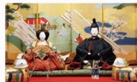
有職雛 徳川美術館蔵