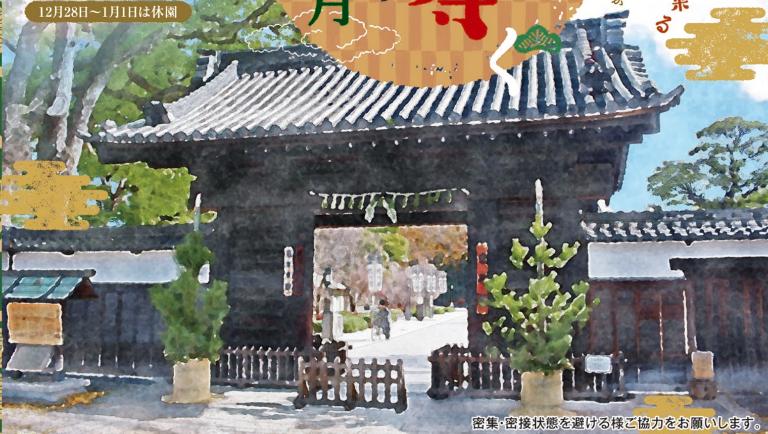
密集・密接状態を避ける様ご協力をお願いします。