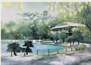
※イラストはイメージです