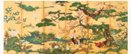
四季花鳥園屏風 六曲一双 江戸時代 17世紀 伝狩野山楽筆

徳川美術館 TEL:(052)935-6262 FAX:(052)935-6261 名古屋市 蓬左文庫 TEL:(052)935-2173 FAX:(052)935-2174