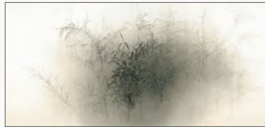
めだけ 平成19年(2007) 個人蔵

午前10時～午後5時(入館は午後4時30分まで) 休館日/月曜日(但し、5月3日(月・祝)～5日(水・祝)は開館、翌6日(木)は休館)