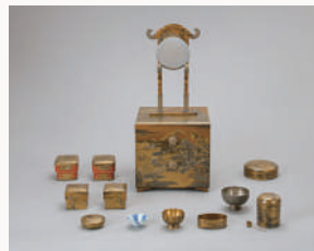
国宝 初音蒔絵鏡台 千代姫(尾張家2代光友正室)所用

午前10時～午後5時(入館は午後4時30分まで) 休館日/月曜日(ただし、9/20[月・祝]は開館、翌21日[火]は休館)