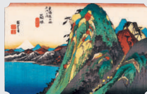
東海道五拾三次之内 箱根 湖水園 (保永堂版 部分) 個人蔵