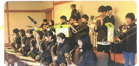
中部楽器技術専門学校吹奏楽部