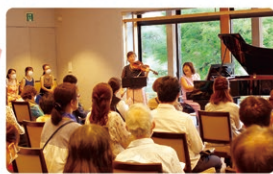
昨年のコンサートの様子

ピアノがメインの癒しの音楽。徳川園の景色を眺めながら過ごすゆったりとした時間をお楽しみください。