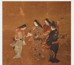
重要文化財 本多平八郎委絵屏風(部分) 徳川美術館蔵

※20名様以上の団体は一般200円、その他100円割引 (毎週土曜日は高校生以上入館無料)