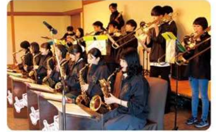
中部楽器技術専門学校吹奏楽部