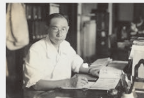
古文書を読む義親(昭和10年(1935))