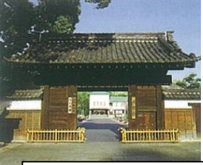
1 | 黒門 (くろもん) 登録有形文化財