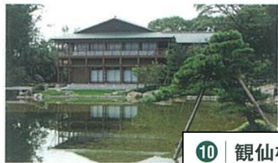
10 | 観仙楼 (かんせんろう)