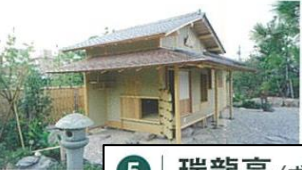
5 | 瑞龍亭 (ずいりゅうてい)