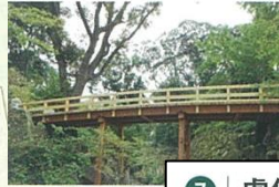
7 | 虎仙橋 (こせんきょう)