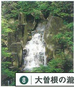
8 | 大曾根の瀧 (おおぞねのたき)