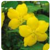
ヤマブキ【山吹】 4月中旬～4月下旬