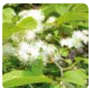
サワフタギ【沢蓋木】 4月下旬