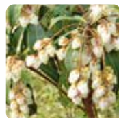
アセビ【馬酔木】 3月上旬～4月中旬