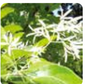
ヒトツバタゴ【なんじゃもんじゃ】 5月上旬