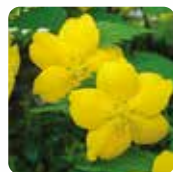
オウバイ【黄梅】 2月下旬～3月下旬