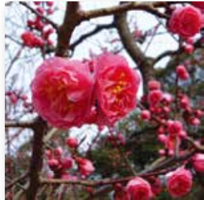
ウメ【淋子梅】 3月中旬～4月上旬 早春の山里林や茶室のそばを美しく彩る梅の花。杏(アンズ)や桃(モモ)の花と咲き競い、その芳しい香りも魅力的。サクラとは対照的にゆっくり咲き、ゆっくと散っていく。 ※昨今の暖冬傾向のため、梅の開花は早まることがあります。