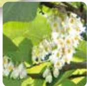
ハクウンボク【白雲木】 4月下旬～5月上旬