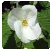
シロヤマブキ【白山吹】 4月中旬～4月下旬