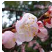
アンズ【杏】 3月中旬～3月下旬