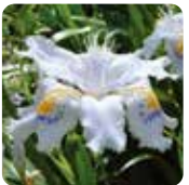
シャガ【射干】 4月中旬～5月中旬