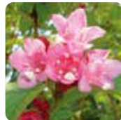
タニウツギ【谷空木】 4月下旬～5月中旬