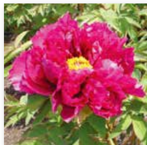
ボタン【牡丹】 4月上旬～4月下旬 大名庭園にはつきもの花。その豪華であでやかな姿は「百花の王」とも形容され、春の庭園を鮮やかに彩る。徳川園内外にはおよそ55品種、約1000株の牡丹が植栽されている。見頃の花は、年毎に多少違います。