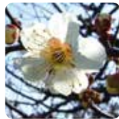
ウメ【白加賀】 3月上旬～3月下旬