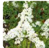
ユキヤナギ【雪柳】 3月下旬～4月上旬