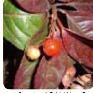
ヤブコウジ【藪柑子】