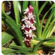
キチジョウソウ【吉祥草】