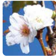
コブクザクラ【子福桜】