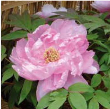
冬ボタン【冬牡丹】 春に華やかに咲き誇る牡丹を温度管理し咲かせており、「時期はずれ」を珍重する想いを感じる。わら囲いが、さらに冬の風情をかます。