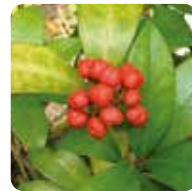
ミヤマシキミ【深山樺】

ツバキ【椿】 花が美しく利用価値も高いので万葉集の頃からよく知られたが、特に近世に茶花として好まれ多くの園芸品種が作られた。園内各所には、様々な種類のツバキが植えられている。(写真は有楽椿)