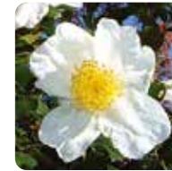
サザンカ(白)【山茶花】