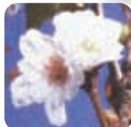
コブクザクラ【子福桜】 11月下旬～3月下旬