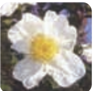
サザンカ【白】(山茶花) 11月下旬～3月下旬