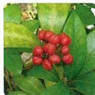
ミヤマシキミ【深山樺】