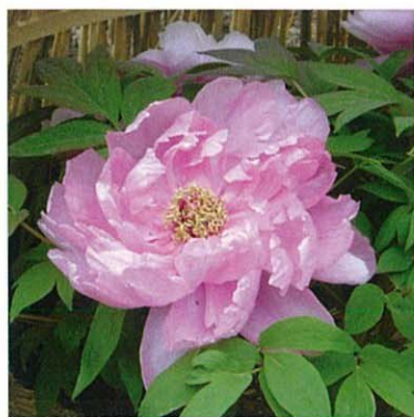
フユボタン【冬牡丹】

春に華やかに咲き誇る牡丹を温度管理し咲かせており、「時期はずれ」を珍重する想いを感じる。わらわいが、さらに冬の風情をかます。