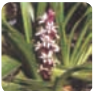
キチジョウソウ【吉祥草】 11月下旬～12月中旬