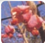
マユミ【真弓】 12月上旬～1月中旬