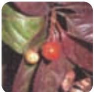
ヤブコウジ【藪柑子】 11月下旬～2月上旬