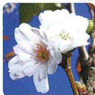
コブクザクラ【子福桜】

春に華やかに咲き誇る牡丹を温度管理し咲かせており、「時期はずれ」を珍重する想いを感じる。わらわいが、さらに冬の風情をかます。