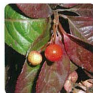
ヤブコウジ【藪柑子】