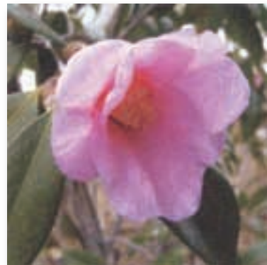
ツバキ【椿】 1月中旬～3月下旬 花が美しく利用価値も高いので万葉集の頃からよく知られたが、特に近世に茶花として好まれ多くの園芸品種が作られた。園内各所には、様々な種類のツバキが植えられている。(写真は有楽椿)