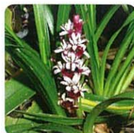
キチジョウソウ【吉祥草】