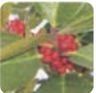
タラヨウ【多羅葉】 11月下旬～1月下旬