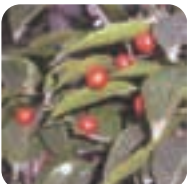
ソゴ【冬青】 11月下旬～2月上旬