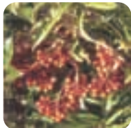
マンリョウ【万両】 11月中旬～2月中旬