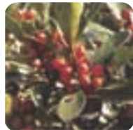
モチノキ【麩の木】 11月下旬～2月中旬