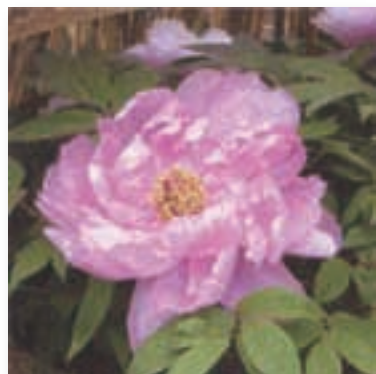
フボタン【冬牡丹】 1月上旬～2月中旬 春に華やかに咲き誇る牡丹を温度管理し咲かせており、「時期はずれ」を珍重する想いを感じる。わらわいが、さらに冬の風情をかもす。