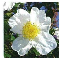
サザンカ(白)【山茶花】